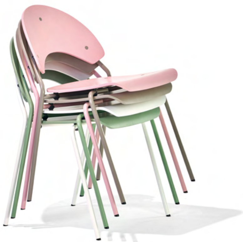
bis 10 Stück stapelbar