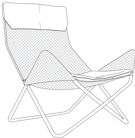
Outdoor mit Kissen